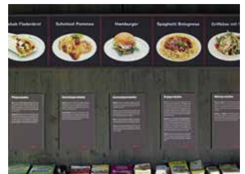
Abb. 3: Schnitzel Pommes oder Hamburger ohne Fleisch? – Der Pavillon liefert mit seinen Rezeptkarten vegetarische Alternativen.

Diese dialogische Inszenierung wie auch das Gräserland als Narrative Environment sind Versuche, die komplexen Themen der Nachhaltigkeit verständlich und attraktiv darzustellen. Ob dies klappt, ist Gegenstand weiterer Untersuchungen. Bereits haben sich diverse Gruppen und Schulklassen angemeldet, welche das