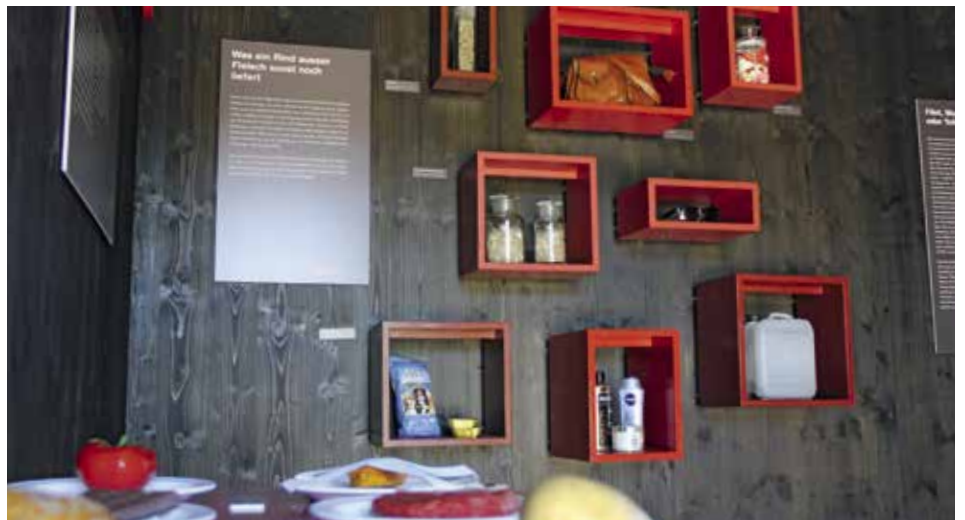
Abb. 2: Kritischer Blick auf unseren Fleischkonsum: Die neue Ausstellung bietet eine differenzierte Darstellung.