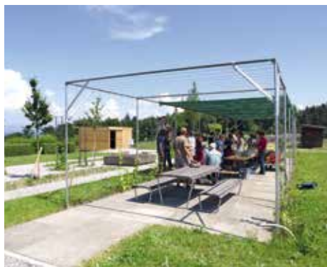
Abb. 1: Am 5. Juni wurde der Pavillon «Fleisch, aber» eröffnet und ist nun für Besucherinnen und Besucher unter der Woche zugänglich.

Essen Sie gerne saftige Steaks oder greifen Sie eher zum Vegischnitzel? Die Folgen dieser Entscheidung werden im neuen Pavillon «Fleisch, aber» auf dem ZHAW-Campus Grüental in Wädenswil dargestellt. Damit nimmt die Ausstellung ein wichtiges Thema aus dem Gräserland auf, das als sogenanntes «Narrative Environment» konzipiert ist. Das Gräserland stellt die grundlegende Bedeutung der Gräser für unsere Geschichte und unser Leben dar. Als Narrative Environment hat es das Ziel, die Sinne anzuregen und Inhalte direkt erlebbar zu machen. Das Thema Fleischkonsum wird zum Beispiel in Form eines Flächenvergleiches dargestellt: Wie viel landwirtschaftliche Fläche ist für die Produktion von einem Kilogramm Rindfleisch im Vergleich zu einem Kilogramm Brot nötig? Eine differenzierte und vertiefte Darstellung von Inhalten ist im Gräserland-Garten hingegen nicht möglich. Dazu dient nun die Ausstellung im neuen Pavillon.