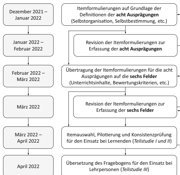
Abb. 2 Iterativer Entwicklungsprozess des Erhebungsinstruments zum Einsatz bei Lernenden und Lehrpersonen