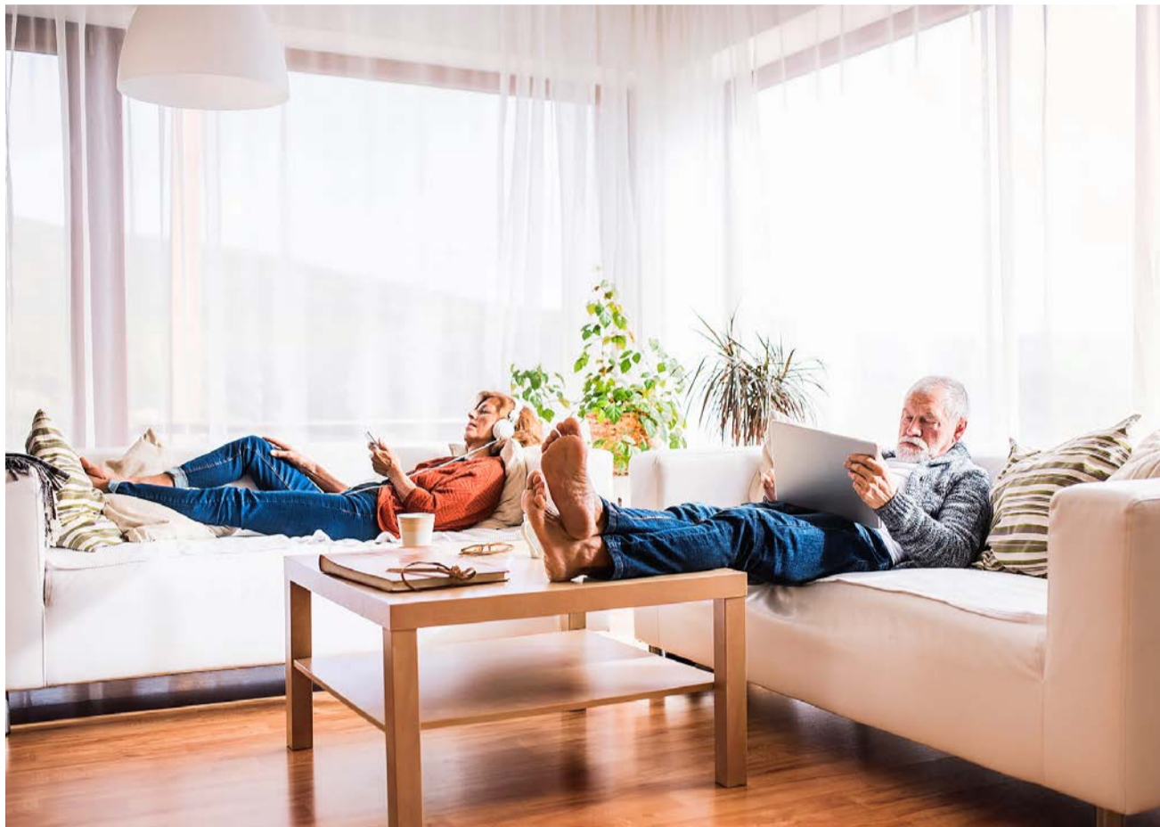
Hat man die «Karrierestufe» des Wohneigentums erklommen, wird ein «Rückschritt» – zurück zum Mieten – nur selten vorgenommen.

Mehr Wohnraum wird im Normalfall mit einem Eigenheim verbunden. Es ist bekannt, dass Eigentumswohnungen/-häuser mehr Wohnfläche bieten. Im Jahr 2021 lag die durchschnittliche Wohnfläche der Eigentümer und Eigentümerinnen um 13 Quadratmeter höher als bei den Mietern und Mieterinnen.