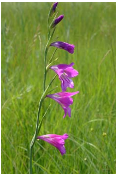
Die blühende Sumpfgladiole, eine elegante Schönheit unter den einheimischen Seltenheiten!