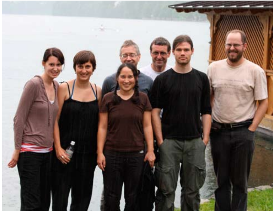
Gruppenfoto bei Regen

Die internationale Fachwoche der Vertiefung Environmental Education hatte zum Thema, sich mit dem Nationalpark Triglav auseinanderzusetzen und den Tourismus in dieser Gegend zu studieren. Die nächsten zwei Tage erkundeten wir wandernd die weiten Wälder und steilen Täler rund um Trenta, überboten uns gegenseitig in der Anzahl geknipster Fotos, bestiegen abfallende Hänge und beugten uns über tiefe Abgründe, immer auf der Suche nach dem perfekten Motiv. Diese