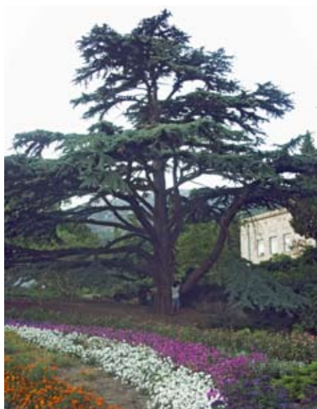
Einjährige Sommerblumen am Fuss einer Zeder

Zu den ersten Neuankömmlingen im Park gehörten auch Pinien, die hier «Italienische Kiefer» ( Pinus pinea ) genannt werden. Der Tulpenbaum ( Liriodendron tulipifera ), die mächtige, säulenartig gewachsene, grossblütige Magnolie ( Magnolia grandiflora ) und die oft gepflanzte Yucca ( Yucca macrocarpa ) dürften ebenfalls die Anfangsjahre des Gartens erlebt haben. Später kamen aus der Neuen Welt die beiden amerikanischen Mammutbäume ( Sequoia und Sequoiadendron ) dazu; sie wachsen seit ihrer Aussaat auf gleicher Augenhöhe. Zedern und Pinien sind mit den verschiedensten Gehölzen zu abwechslungsreichen Pflanzenbildern kombiniert. An anderer Stelle ziehen Palmen ( Trachycarpus fortunei ) gerade Linien durch den Garten und begrenzen reichblühende Promenaden. ●