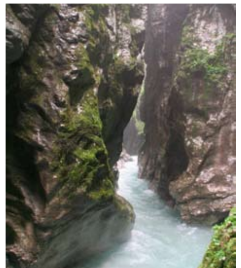
Titelbild: siehe Seite 13 «Pivo prosim!» – oder wie man sich interessiert durch Slowenien isst

Frühere Nummern können heruntergeladen werden unter: www.unr.ch/unrintern