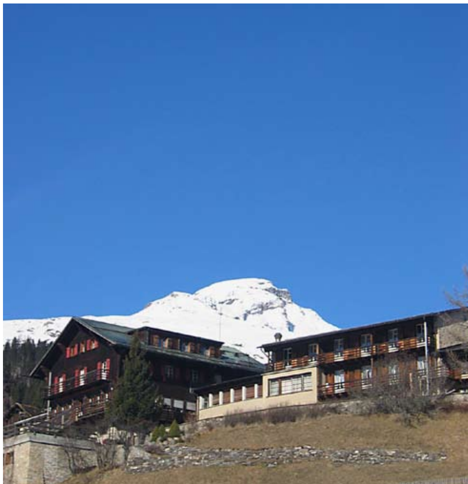
Das Hotel Piz Vizà ist Hotel, Fachstelle und Innovationszentrum in einem. Im Hintergrund der Piz Beverin

Nach Feierabend schnürt das Team der Fachstelle die Wanderschuhe, packt den Rucksack und marschiert los. In einer spontanen Aktion besteigen wir bei wunderschöner Abendstimmung unseren Hausberg, den Piz Beverin. Auf dem Weg zum Gipfel kreuzt ein Wiesel unseren Weg, rechts und links verschwinden kugelrunde Murmeltiere eilig in ihren Bau, weiter oben klettert ein Steinbock über die Felsen, die wenigen Wanderer, die uns begegnen, sind alle auf dem Weg ins Tal. Oben auf knapp 3000 Meter bläst ein kalter Wind, der uns aber nicht davon abhält, bei Wein und Abendlicht die Aussicht zu genießen. Während die umliegenden Gipfel noch von den letzten Sonnenstrahlen beleuchtet werden, nehmen wir den Weg ins Tal wieder unter die Füße. Ein tolles Erlebnis und ein schöner Abschluss für mein Praktikum in Wergenstein! ●