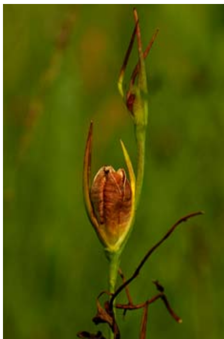
Das Saatgut ist erntereif, wenn die Kapsel oben aufspringt, die Samen aber noch nicht vollständig zu Boden gefallen sind.