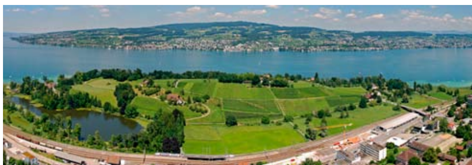
Die Halbinsel Au als Panorama

Durch die Neuorganisation wird angestrebt, die frei gewordene Stelle mit einem wissenschaftlichen Mitarbeiter zu besetzen. Dadurch erhalten wir die nötigen Ressourcen, um neben der Lehre und den Dienstleistungen auch den dritten Leistungsauftrag der Fachhochschule, Forschung und Entwicklung, zu erfüllen. Wir suchen einen erfahrenen Wissenschaftler mit dem nötigen Know-how in Weinbau und Pflanzenernährung. Die Stelle ist ausgeschrieben und wir hoffen, das neue Jahr mit dem vollständigen Team zu starten. ●