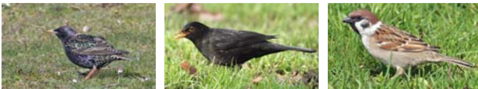
Die wichtigsten Trauben fressenden Vögel: Haussperling, Passer domesticus (Grosses Bild oben). Untere Bildreihe von links nach rechts: Star, Sturnus vulgaris; Amsel, Turdus merula und Feldsperling, Passer montanus.

zugen junge Reben. Entgegen den einmaligen Schäden, die Vögel verursachen, können Wildtierschäden mittelfristig Auswirkungen auf Rebstöcke haben; es muss auch in den Folgejahren mit einem Ernteverlust gerechnet werden. Traubenschäden durch Wild können (im Gegensatz zu Vogelfrassschäden) dem Amt für Jagd und Fischerei gemeldet werden. Die Kosten werden je nach Umfang vom Kanton abgegolten. Rehschäden werden allenfalls direkt von der Jagdgesellschaft übernommen. Im Vergleich zu Vögeln sind die meisten Säugetiere mit Zäunen abzuwehren. Zäune belasten die Umwelt weniger. Sie sind gesellschaftlich besser akzeptiert und die Gefährdung von Wildtieren durch Zäune lässt sich durch sorgfältige Montage stark reduzieren.