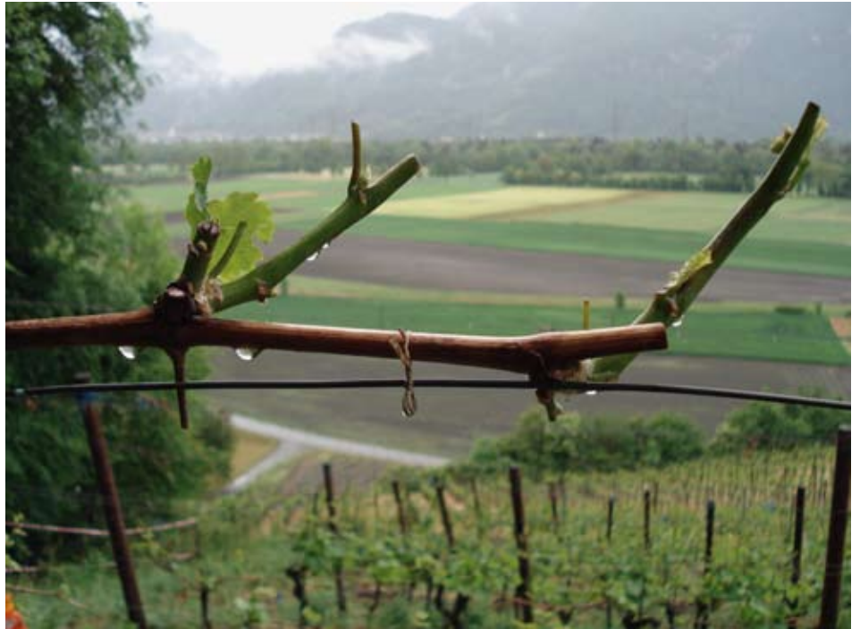
Vom Reh abgefressener Trieb.

zu fixieren. Um Rebnetze nicht zu einer tödlichen Gefahr für Tiere werden zu lassen, müssen einige Punkte berücksichtigt werden. Das Merkblatt Nr. 404 «Alles vernetzt?» der Forschungsanstalt Agroscope Changins-Wädenswil ACW gibt Anweisungen zur korrekten Verwendung der Rebnetze. Zehn Regeln gilt es einzuhalten: