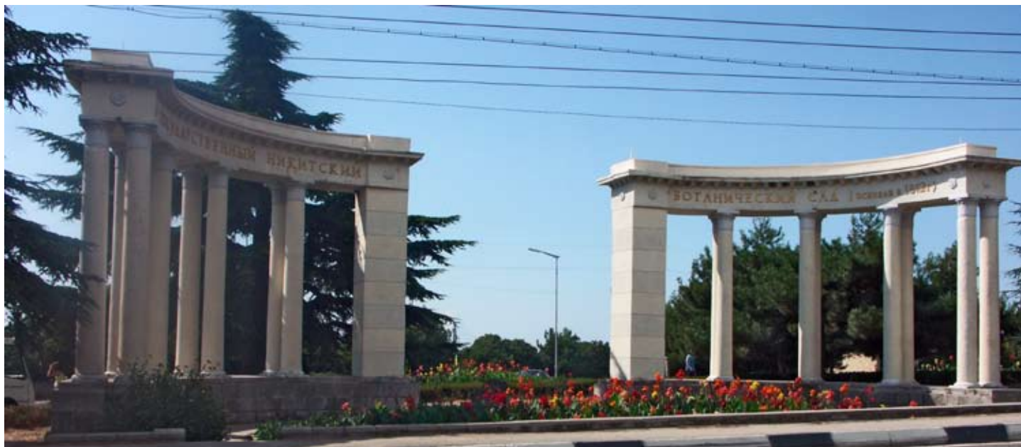
Eingangsmonument an der Hauptstrasse

Züchtungen, die ihre Pracht im Herbst entfalten. Solche Blütenevents sind wichtig für den Erhalt des Gartens, denn sie locken zahlreiche Besucher an. In den geschilderten Sammlungen wird eine umfangreiche genetische Ressource gepflegt und erhalten. Es werden hier, einer alten Tradition folgend, die Leistungen früherer Züchter gepflegt, gezeigt und dadurch der Nachwelt