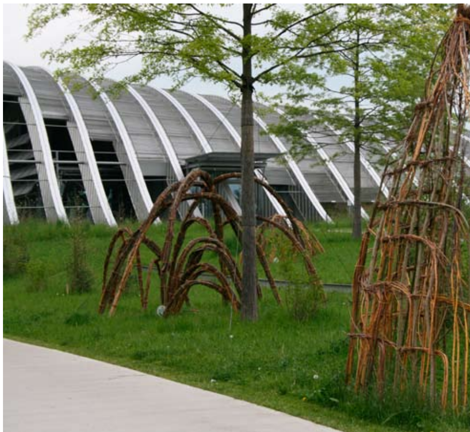
Modern interpretierte Maulwurfshügel aus dem Garten der Erinnerung .

Livia Klees Erinnerungen werden in frei abstrahierender Form auf dem Gelände des «Zentrum Paul Klee» wiedergegeben. Kein lupenreiner Bauhausgarten, sondern die Interpretation der subjektiven Kindheitserinnerungen war das Ziel der Planung. Heckenelemente und übergrosse Maulwurfshügel beherrschen die Szene.