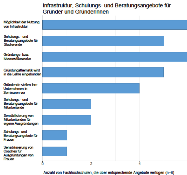
Abb. 1: Strategische Verankerung der Gründungsförderung

Wie Abbildung 1 zeigt, geben alle in der schriftlichen Befragung erreichten sechs Fachhochschulen an, bei Berufungsverfahren die unternehmerische Erfahrung der Bewerber und Bewerberinnen zu berücksichtigen. Ebenso soll es vielerorts eine (Transfer-)strategie zur Regelung des Technologie- und Wissenstransfer geben. Weitaus seltener werden jedoch Gründungsaktivitäten im umfassenden Sinne einer strategischen Planung unterworfen. Nur drei von sechs Hochschulen verfügen über eine explizite Gründungsstrategie, welche Ausgründungsprojekten auch innerhalb des Wissenstransfers größeren Stellenwert zuweist. Nur an zwei Hochschulen werden sodann gründungsstrategische Überlegungen mit weiteren strategischen Aspekten verbunden, etwa mit einer für die Außenwirkung von Hochschulen wichtigen Internationalisierungsstrategie.