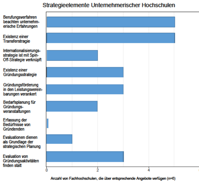
Abb. 3: Infrastruktur, Ausbildungs- und Beratungsangebote für Gründerinnen und Gründer

Dabei findet sich an den Hochschulen mit Blick auf Studierende die Einschätzung, dass die Vermittlung von unternehmerischen Orientierungen und Kompetenzen auch ohne unmittelbaren Bezug zur Förderung konkreter Gründungsprojekte möglich und wünschenswert sei. Gefördert werden soll eine zeitgemäße, innovationsorientierte Denk- und Verhaltensweise auch bei jenen Studierenden, die später einer abhängigen Beschäftigung nachgehen. Die tatsächliche Realisierung von Gründungsprojekten erscheint dann vielfach lediglich als eine erwünschte Folge der „Entrepreneurship Education“ an den Fachhochschulen, aber keinesfalls als ihr unabdingbarer Erfolgsnachweis.