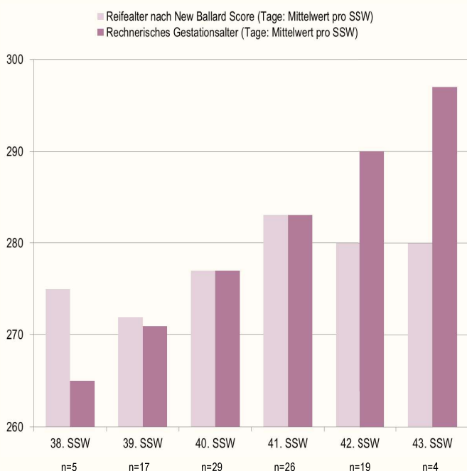
Abbildung 1: Befundetes Reifealter und rechnerisches Gestationsalter (n=100)

( p < 0.001 ). Aus den Daten ist abzulesen: Umso weiter nach dem ET die Kinder geboren werden, desto unreifer sind sie in Bezug auf das rechnerische Gestationsalter (siehe Abb.1).