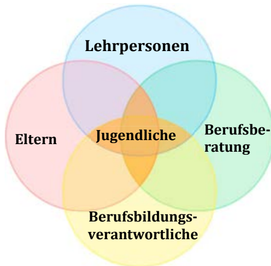
Abbildung 1: Kooperationspartner in der ersten Berufswahl nach Schmid (2015)

Im Zentrum steht die oder der Jugendliche. Die Jugendlichen setzen sich mit ihrer Ausgangslage und dem Bildungssystem auseinander, lernen ihr Selbstbild mit dem Fremdbild kritisch abzugleichen und können Berufe und Ausbildungen analysieren und dazu Stellung beziehen. Sie gleichen ihre Persönlichkeit mit den Anforderungen der Ausbildung ab und können sich für eine schulische oder berufliche Ausbildung entscheiden. Sie treten selbstbewusst auf und argumentieren glaubwürdig.